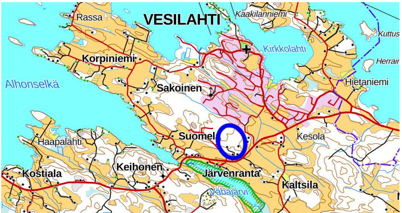
Kaava-alueen sijainti. Asemakaavan muutoksen sijainti on esitetty sinisellä soikiolla.

OAS:ssa siis kerrotaan, miksi kaava laaditaan, miten prosessi etenee ja missä vaiheessa siihen voi vaikuttaa.