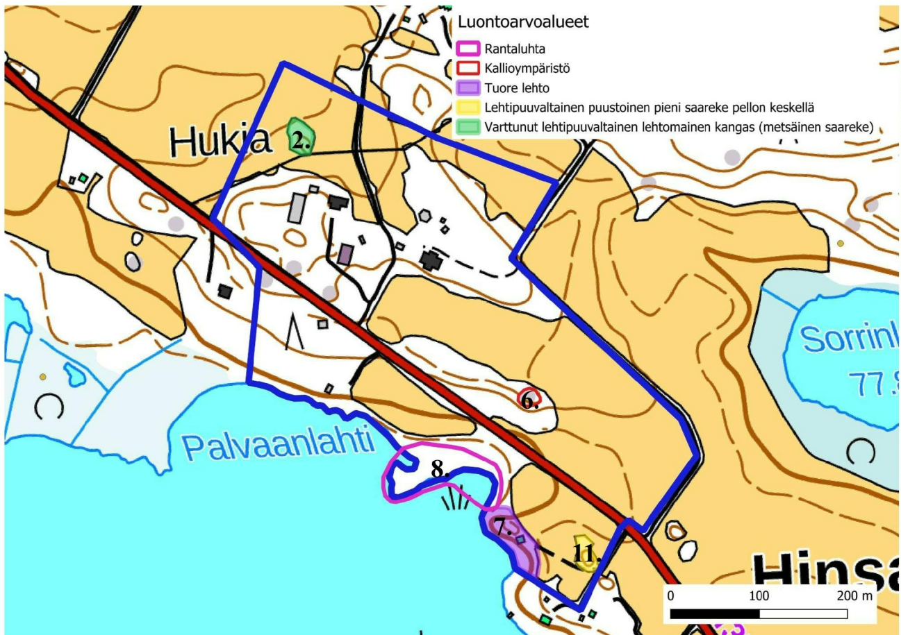
KUVA 5. Selvitysalueen luontoarvot.