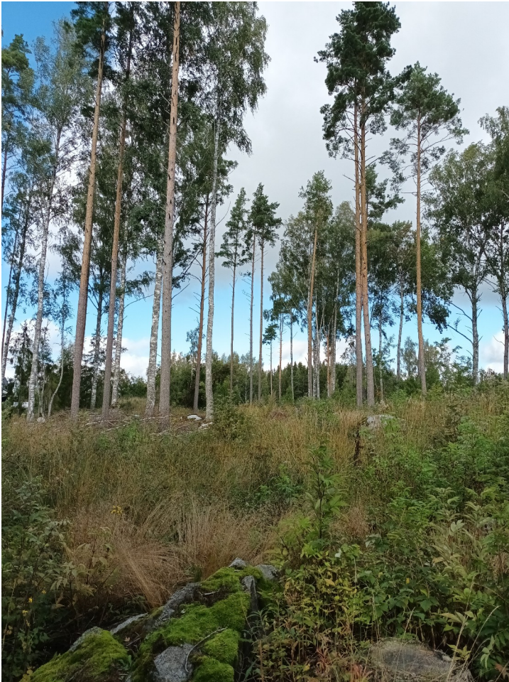
KUVA 8. Hakkuuaukea selvitysalueen pohjoisosassa. Jättopuuna mäntyä, koivua ja haapaa.

Alue oli peltojen ympäröimä hakkuuaukea. Jättopuuna esiintyi mäntyä, koivua ja haapaa. Alueen aluskasvillisuuteen kuuluivat muun muassa mustikka, vadelma, peltovalvatti ja metsälauha. (KUVA 8).