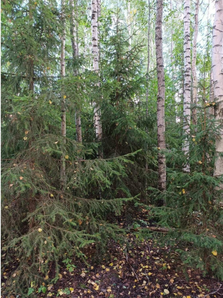
KUVA 17. Rantaluhdan ja Hinsalantien välissä sijaitsevaa metsää.

Maanmittauslaitoksen vuoden 1964 kartan (KUVA 4) mukaan alueella oli sijainnut ennen niittyä. Alueen puustoon kuuluivat muun muassa varttunut koivu, puumaiset pajut, sekä paikoin tiheässä kasvava nuori kuusi, joka teki aluskasvillisuudesta niukkaa. (KUVA 17).