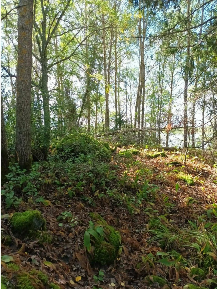
KUVA 12. Selvitysalueen eteläosan rantalehtoa. Taustalla Pyhäjärvi.

Alueen länsiosan etelään-länteen avautuvalla, rantaan rajoittuvalla rinteellä oli maisemallisten arvojen lisäksi luontoarvoja. Alueen pitkälti luonnontilaiseen puustoon kuuluivat niin luonnon monimuotoisuudelle tärkeät varttuneet haavat, kuin lahoppuustoakin. Edellä mainitut ovat tärkeitä monipuolisen lajiston elinympäristöjä. Rannan ja pellon reunavaikutus lisää alueen luonnon monimuotoisuutta. Luonnon monimuotoisuuden vaalimiseksi alueen ominaispiirteet olisi suotavaa mahdollisuuksien mukaan säilyttää.