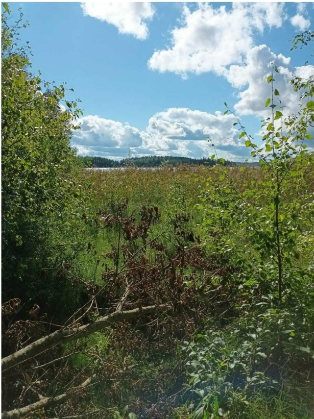
KUVA 13. Selvitysalueen eteläosan rantaluhtaa.

Rantaluhtat ovat linnustolle tärkeitä pesimis- ja suojavaikkoja, eikä niiden välittömään läheisyyteen siksi suositella rakentamista.