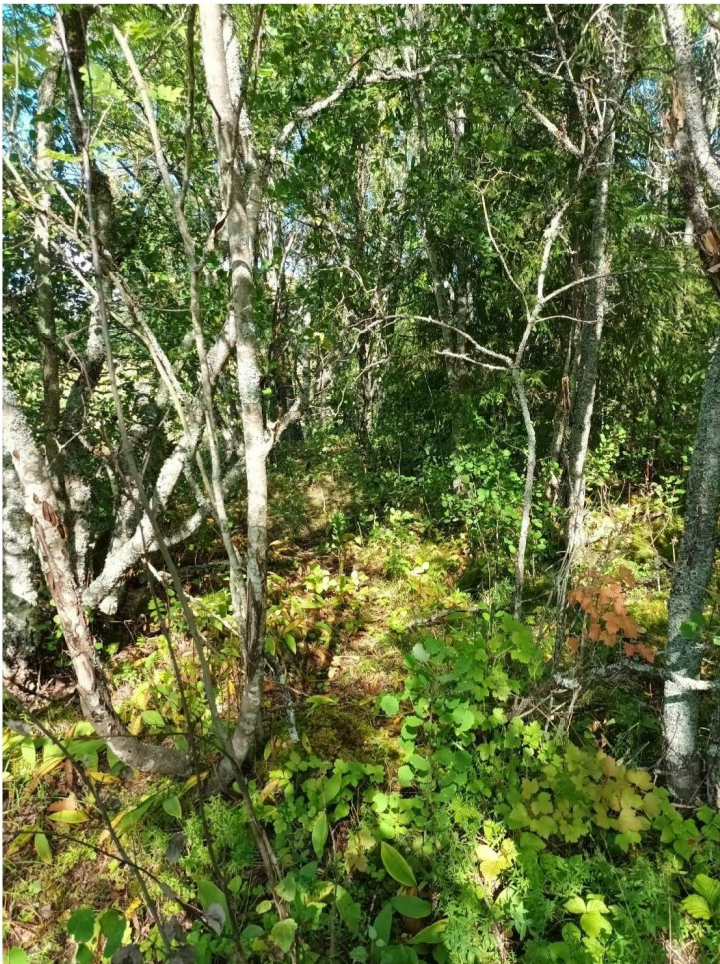
KUVA 7. Selvitysalueen länsiosassa sijaitsevan metsäsaarekkeen kasvillisuutta.

Tämän peltojen keskellä sijaitsevan metsäsaarekkeen puustoon kuuluivat etenkin koivu, pihlaja ja haapa, mutta myös joitain kuusia ja mäntyjä esiintyi. Pensaskerroksessa tavattiin taikinamarjan ja katajan lisäksi lehtipuiden, kuten haavan taimia. Aluskasvillisuuteen kuuluivat muun muassa mustikka, kielo, koiranheisi, lillukka, ahomansikka ja ahomatara. Sammalista havaittiin metsäliekosammal. Kasvillisuudeltaan ja maastoltaan erottuvat metsäiset saarekkeet tuovat eliölajistollista vaihtelua viljely-ympäristöihin lisäten luonnon monimuotoisuutta. (KUVA 7).