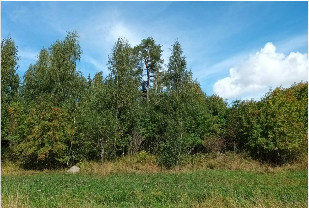
KUVA 10. Metsäinen alue Hinsalantien varrella peltojen keskellä.

Tämän Hinsalantien ja pellon väliin jäävän pienen metsäisen alueen puustoon kuuluivat lehtipuut kuten koivu, pihlaja, tuomi, mutta myös joitain kuusia ja mäntyjä esiintyi. Puusto oli pääosin nuorta. Pensaskerroksessa tavattiin koiranheisi ja taikinamarja. Kenttäkerroksen kasvillisuuteen kuuluivat muun muassa sananjalka, kivikkoalvejuuri, ahomansikka ja kielo. Sammalista havaittiin etenkin metsäliekosammalta. Kasvillisuudeltaan ja maastoltaan erottuvat metsäiset saarekkeet tuovat eliölajistollista vaihtelua viljely-ympäristöihin lisäten luonnon monimuotoisuutta. (KUVA 10).