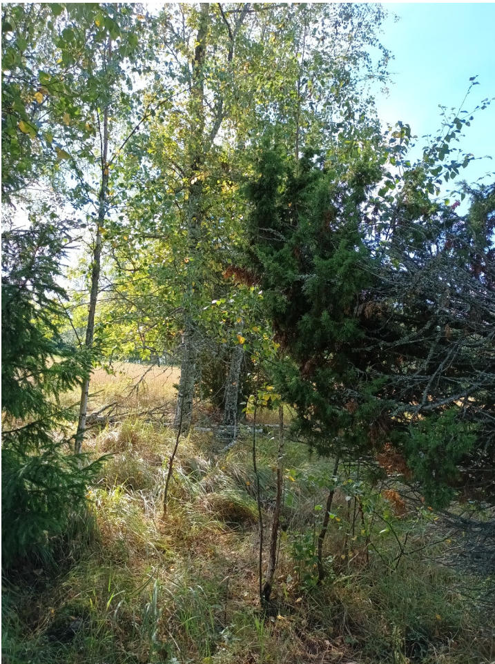
KUVA 16. Puustoinen saareke peltöjen keskellä selvitysalueen itäosassa.

Viljelyksessä olevien peltöjen keskellä sijaitsevan puustoisin saarekkeen puustoon kuuluivat muun muassa koivu, kuusi ja pihlaja. Lisäksi tavattiin katajaa, jota esiintyi myös pensaskerroksessa taikinamarjan ja vadelman ohella. Aluskasvillisuuteen kuuluivat heinien ohella muun muassa ahomatar, koiranputki ja ahomansikka. Kasvillisuudeltaan ja maastoltaan erottuvat metsäiset saarekkeet tuovat eliölajistollista vaihtelua viljely-ympäristöihin lisäten luonnon monimuotoisuutta. (KUVA 16).