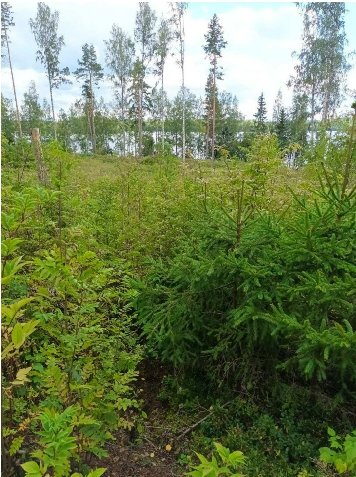
KUVA 14. Selvitysalueen lounaisosan hakkuuaukea.

Hakkuuaukea rajoittui rantaan. Jättöpuuna esiintyi mäntyä, koivua ja haapaa. Alueen kenttäkerroksen kasvillisuuteen kuuluivat muun muassa mustikka, vadelma, maitohorsma ja sananjalka. Pohjoisosiltaan alue oli Maanmittauslaitoksen vuoden 1964 kartan (KUVA 4) mukaan ollut ennen niittyä. Rantavyöhykkeeseen oli säästetty puustoa, kuten koivua, harmaaleppää ja pihlajaa. (KUVA 14).