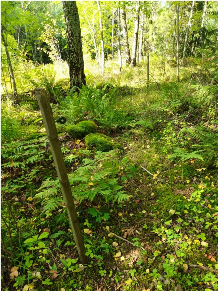
KUVA 6. Lehtomaisen kankaan metsää selvitysalueen länsiosassa.

Alue oli Maanmittauslaitoksen vuoden 1964 kartan mukaan ollut ennen paikoin niittyä (KUVA 4). Alueen puustoon kuuluivat etenkin koivu ja pihlaja. Myös kuusta, raitaa ja vaahteraa esiintyi. Pensaskerroksessa tavattiin taikinamarjaa ja vadelmaa. Kenttäkerroksen kasvillisuuteen kuuluivat muun muassa mustikka, ahomansikka, käenkaali, kielo, sinivuokko, sananjalka ja kivikkoalvejuuri. Sammalista tavattiin etenkin metsäliekosammalta. (KUVA 6).