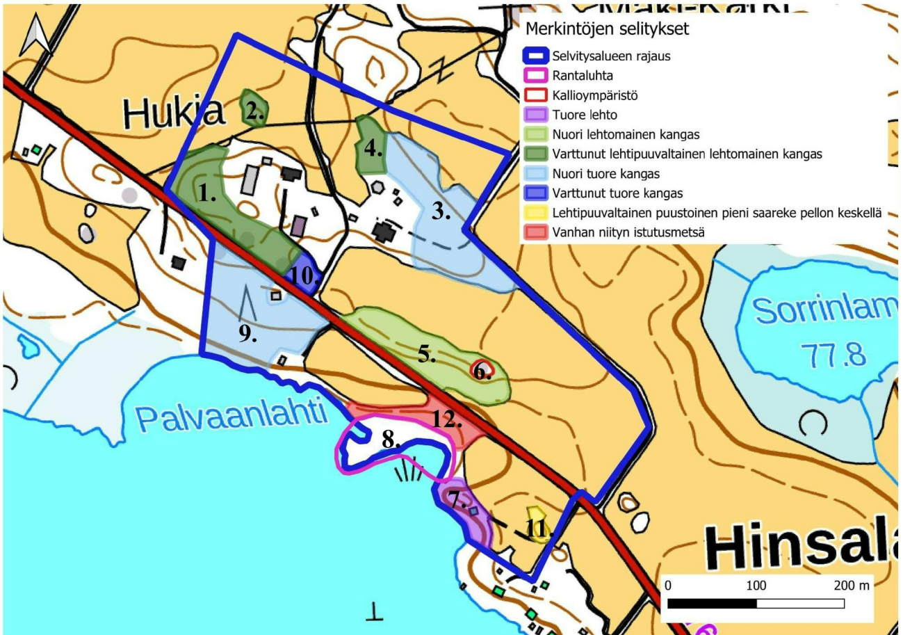
KUVA 2. Selvitysalue maastokartalla rajattuna sinisellä. Alueet 1-12 esiteltä sivulta 9 alkaen. (Kartta: Maanmittauslaitoksen aineistoa 8/2023)