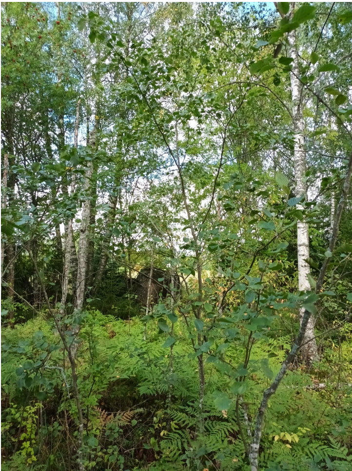
KUVA 9. Puustoinen alue hakkuuaukean ja pellon välissä. Taustalla aluetta ympäröivää peltoa.

Alue sijaitsee pellon ja hakkuuaukean välissä. Puustoon alueella kuuluivat koivu, harmaaleppä, pihlaja ja kuusi. Aluskasvillisuuteen kuuluivat muun muassa mustikka, sananjalka, kielo, koiranheisi ja ahomansikka. Sammalista havaittiin metsäliekosammal. (KUVA 9).