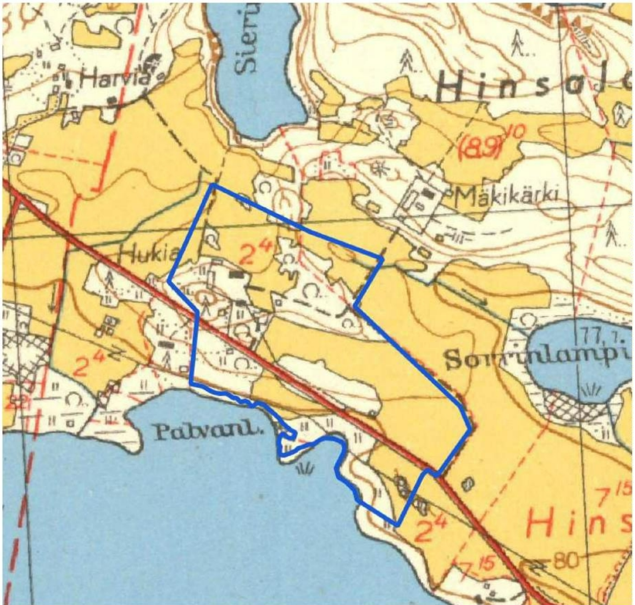
KUVA 4. Maanmittauslaitoksen kartta vuodelta 1964. Sinisellä selvitysalueen rajaus. (Kartta: Vanhatkartat.fi. Maanmittauslaitoksen vanhat painetut kartat)