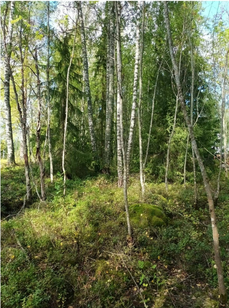
KUVA 15. Tuoretta kangasta selvitysalueen länsiosassa.

Alue oli Maanmittauslaitoksen vuoden 1964 kartan mukaan ollut ennen paikoin niittyä (KUVA 4). Alueen puusto oli kuusivaltaista, mutta myös pihlajaa ja koivua esiintyi. Kenttäkerroksen kasvillisuus oli mustikkavaltaista. Lisäksi esiintyi puolukkaa ja kultapiiskua. (KUVA 15).