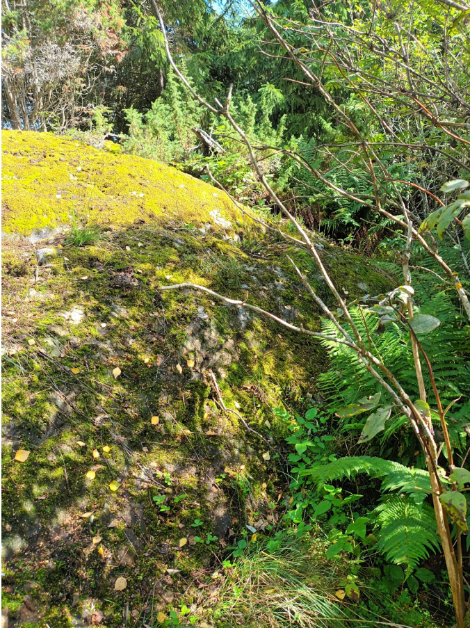
KUVA 11. Kallio selvitysalueen itäosassa.

Alueen puustoon kuuluivat kuusi, koivu, pihlaja ja tuomi. Pensaskerroksessa esiintyi kataja. Muuhun kasvillisuuteen kuuluivat kalliota peittävien sammalten ohella muun muassa haurasloikko, kivikkoalvejuuri ja ahomansikka. (KUVA 11).